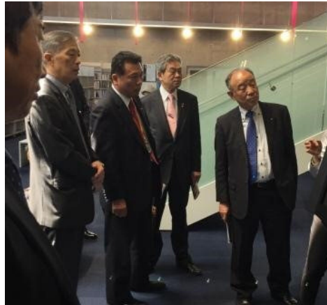
真剣に説明を聞かれる皆様