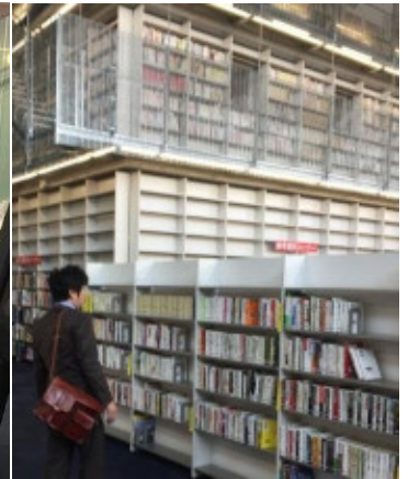
まだまだ蔵書は少ないですが これからどんどん増えるそうです。