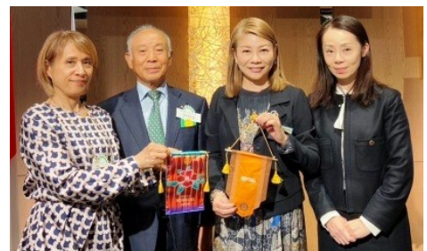
《10/21(月)東京六本木RC様とのバナー交換》