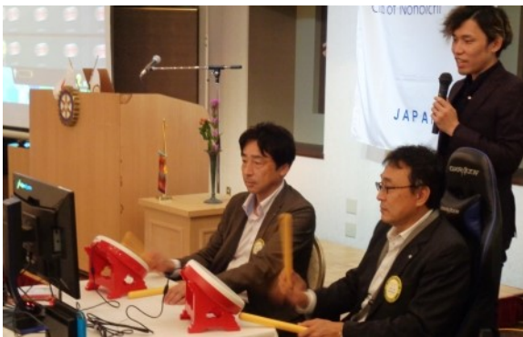
《eスポーツ(太鼓の達人)対決!》